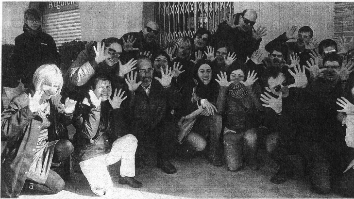
Autoridades y organizadores posaron juntos. J.L.P.