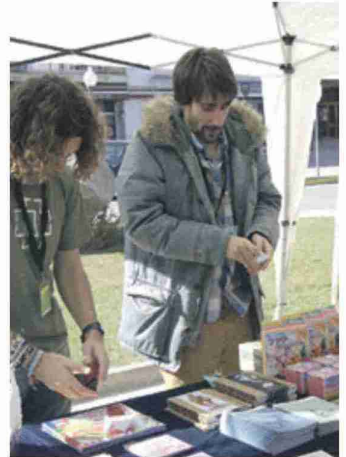
La feria mágica en la Casa de la Vila. J.L.P.

táculo Misteriosa...Mente , desde las cinco de la tarde en el escenario de la Plaza mayor. El cierre del encuentro será a las seis y media de la tarde, en la Gran Gala que Xavier Giró protagonizará en el Pabellón Municipal.