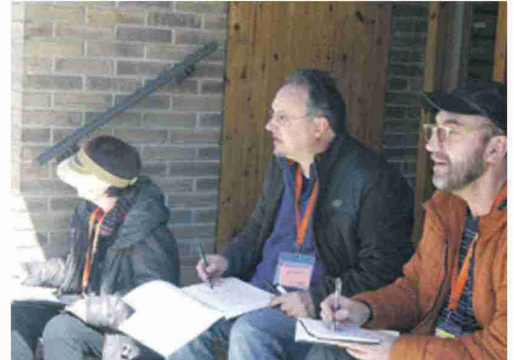
Varios dibujantes plasmaron la jornada en sus cuadernos. J.L.P.