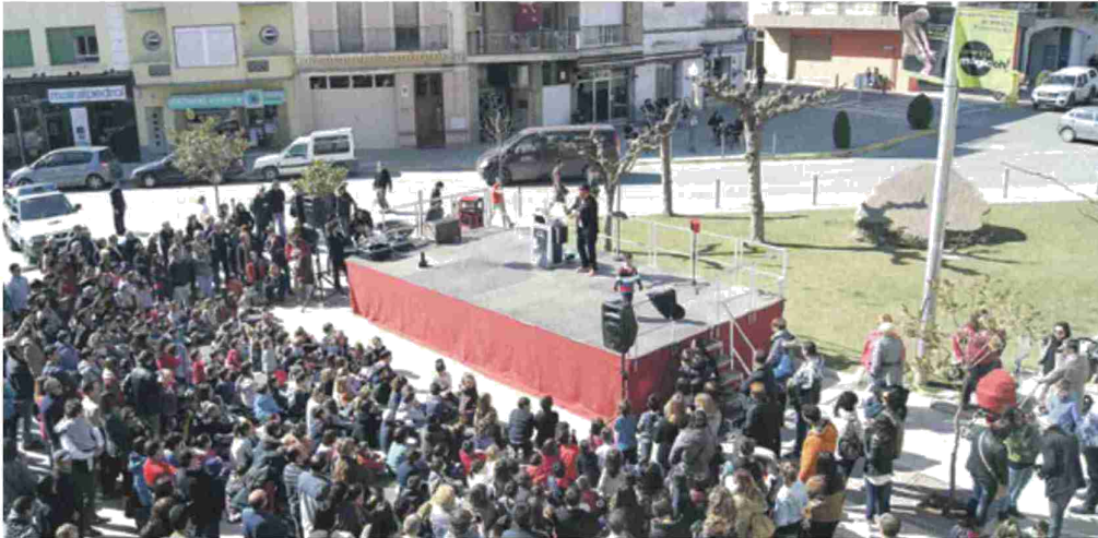
La localidad literana se volcó con el Encuentro. J.L.P.