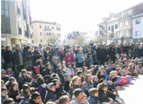
Público de todas las edades siguió el programa de ayer.