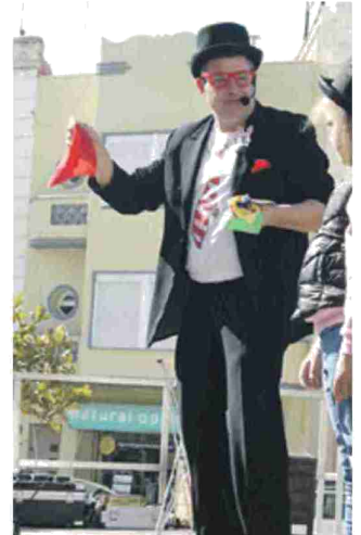
Linaje con su espectáculo infantil. J.L.P.