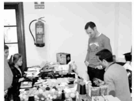
La Casa de la Vila congregó a muchos visitantes. J.L.P.